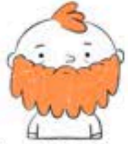
LAURA UND LORENZ